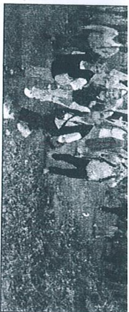
Du tourisme pour se rencontrer